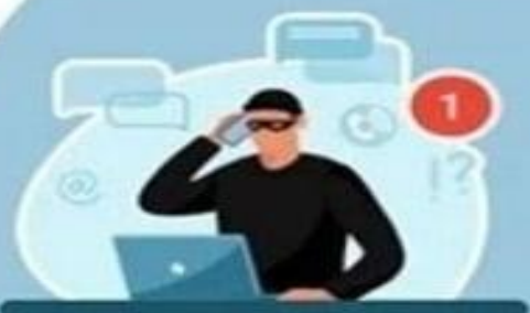
Схема мошенничества на сайтах бесплатных объявлений